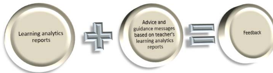
Figure 2. The structure of recommendation and guidance messages based on learning analytics